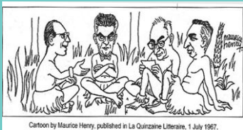
Cartoon by Maurice Henry, published in La Quinzaine Littéraire, 1 July 1967.